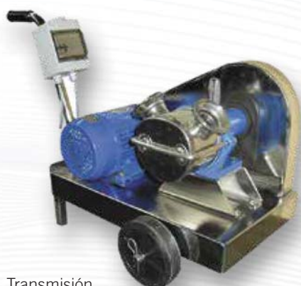
Transmisión mediante correas.