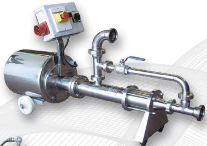
BGi 400 con by-pass de válvula de bola