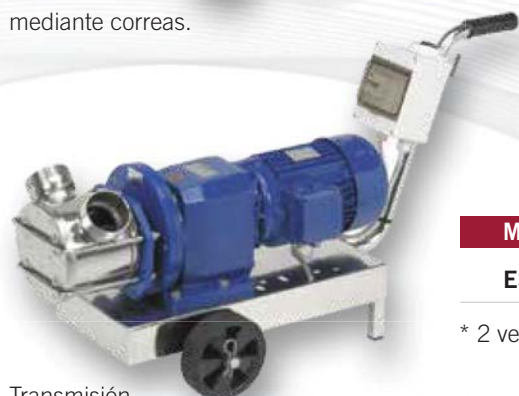
Transmisión mediante motor-reductor.