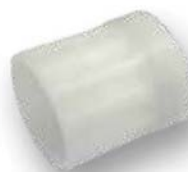
Rosca gas 2" hembra