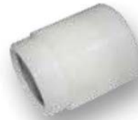
Rosca NW40 macho